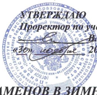
ГРАФИК ПРОВЕДЕНИЯ ЭКЗАМЕНОВ В ЗИМНЮЮ СЕССИЮ 2022-2023 УЧЕБНОГО ГОДА ДЛЯ СТУДЕНТОВ II КУРСА

Кузнецкого института информационных и управленческих технологий (филиал) ФГБОУ ВО «ПГУ»