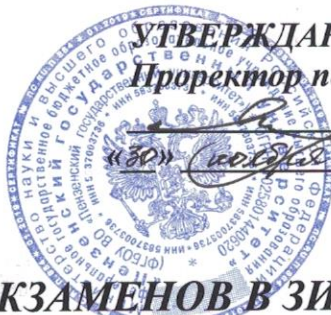
ГРАФИК ПРОВЕДЕНИЯ ЭКЗАМЕНОВ В ЗИМНЮЮ СЕССИЮ 2022-2023 УЧЕБНОГО ГОДА ДЛЯ СТУДЕНТОВ II КУРСА

Кузнецкого института информационных и управленческих технологий (филиал) ФГБОУ ВО «ПГУ»